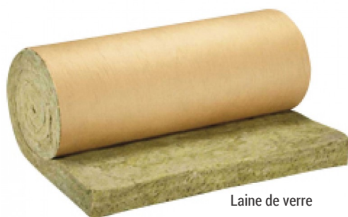
Laine de verre