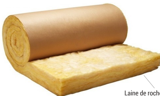
Laine de roche