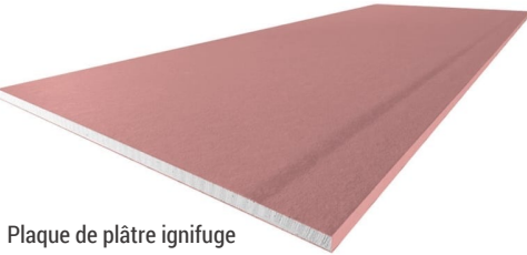
Plaque de plâtre ignifuge