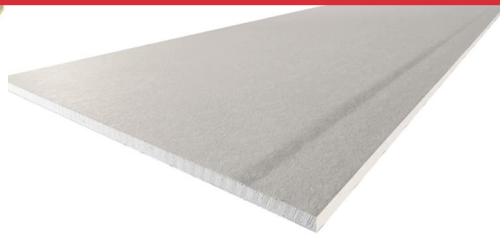
Plaque de plâtre standard