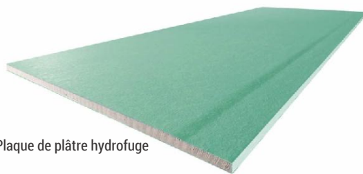
Plaque de plâtre hydrofuge