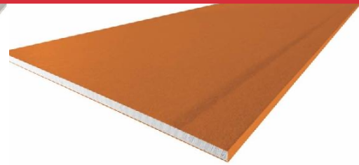
Plaque de plâtre pregywab